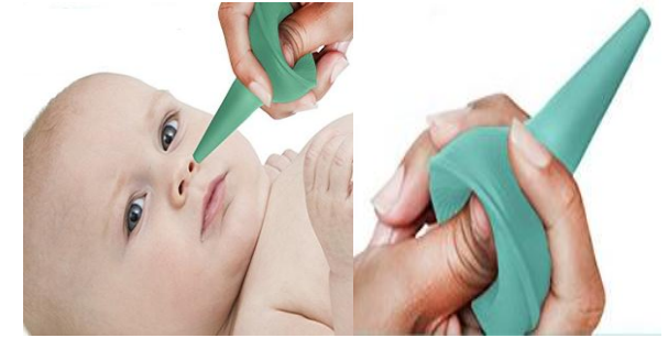
شکل 2: روش استفاده از پوار

اگر شما توصیه‌ها یا اطلاعات بیشتری نیاز دارید لطفاً با شماره تلفن 35262250 - داخلی 260 تماس بگیرید.