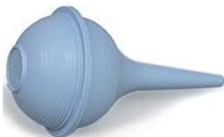
شکل 1: پوار

اول قسمت تویی پوار را فشار دهید و در این حالت به آرامی وارد سوراخ بینی کنید بعد فشار روی توپ را بردارید تا ترشحات بینی به داخل پوار کشیده شوند. پوارها معمولاً یکبار مصرف هستند ولی اگر یکبار مصرف نیست و قطعات آن از هم جدا می شود بعد از هر بار استفاده آنها را جدا کنید و بشوید.